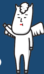
Hakuba village character VICTOIRE CHEVAL BLANC MURAO III